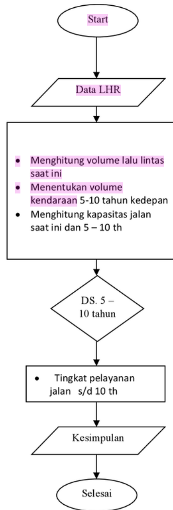
Gambar 3.1 Diagram Penelitian