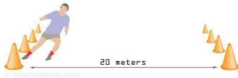
Gambar 1 Multistage Fitness Test

Teknik pengumpulan data kebugaran mahasiswa melalui tes Multistage Fitness Test (MFT) untuk mengetahui nilai VO2Max. Tes ini dilakukan dengan cara lari bolak balik sejauh dua puluh meter sambil mendengarkan aba-aba. Jika ada bunyi "beep" maka peserta tes harus berlari ke arah yang sudah ditentukan sejauh dua puluh meter bolak balik mengikuti irama bunyi "beep" hingga batas kemampuan maksimal peserta.