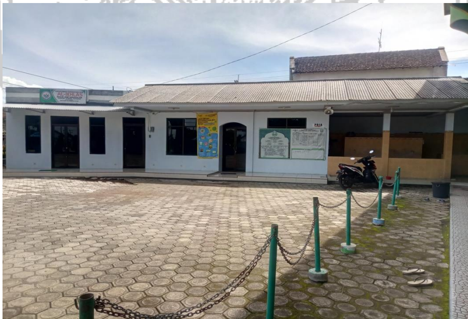
Ruang Sekretariat Ta'mir Masjid Jami' Darussalam Glenmore