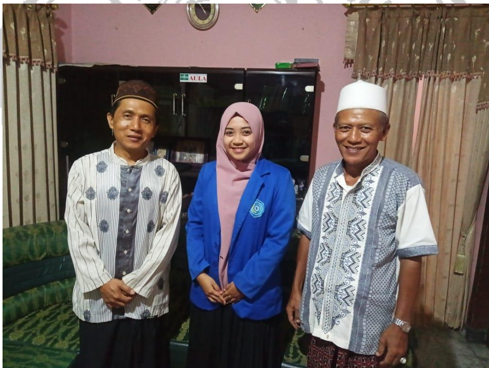
Papan Informasi Keuangan Masjid Jami' Darussalam Glenmore