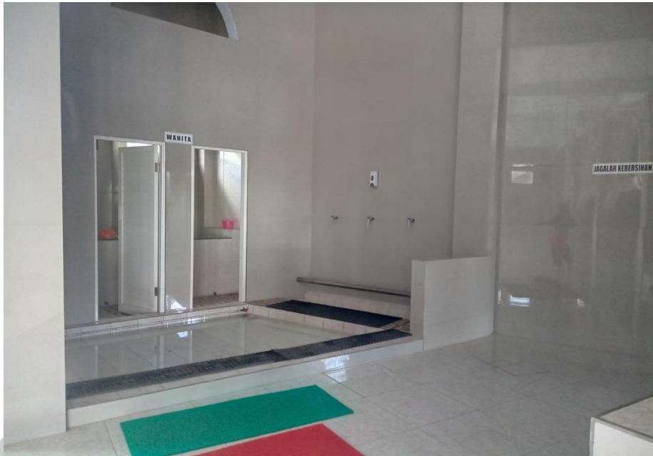
Kamar Mandi dan Tempat Wudlu