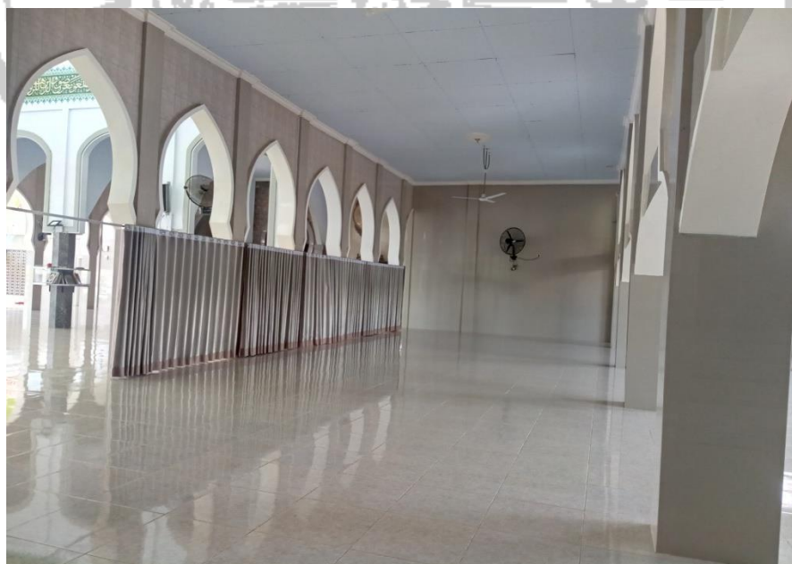
Tempat Ibadah Khusus Perempuan