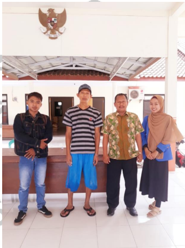
Lampiran 39. Dokumentasi