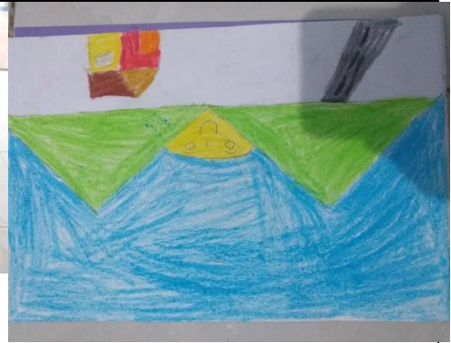
Hasil karya anak menggambar pemandangan