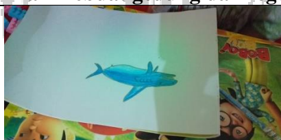
Karya anak menggambar ikan