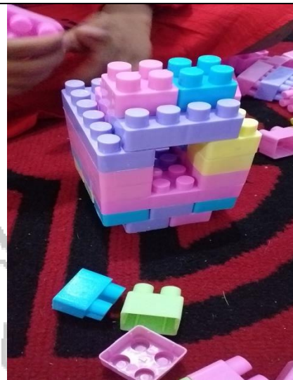
Hasil karya anak membuat rumah dari lego