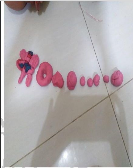
Hasil karya anak membuat kupu-kupu dan kue