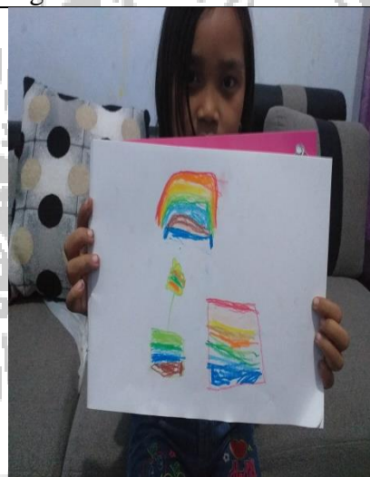
Hasil karya anak menggambar pelangi