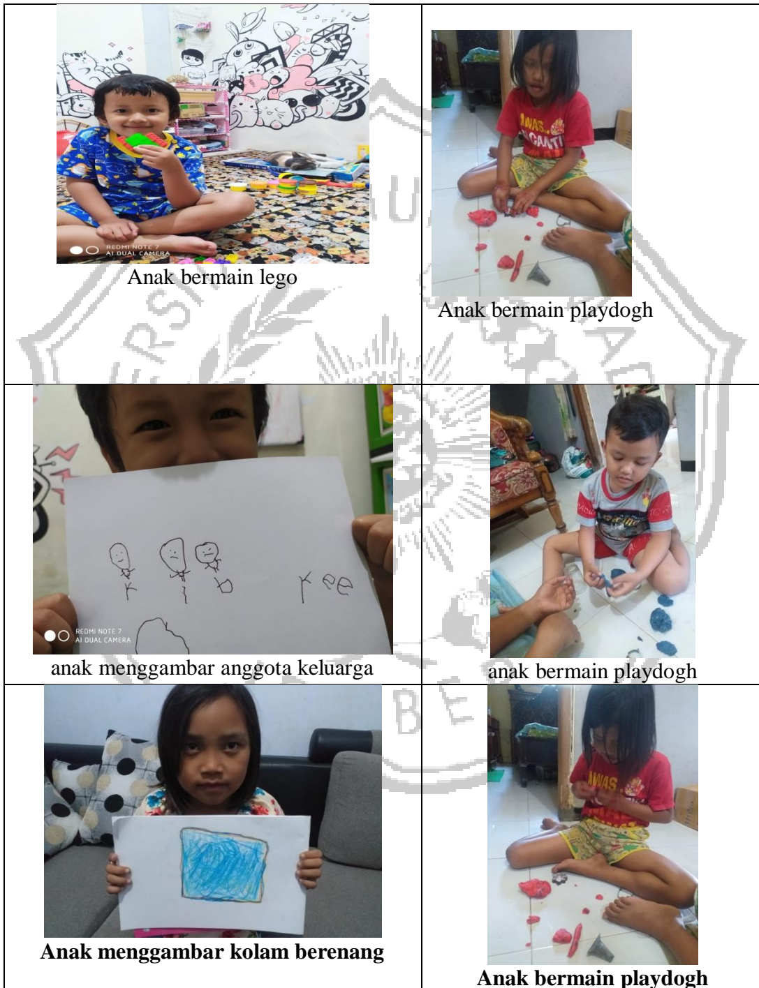
Gambar 2.1 Studi Pendahuluan