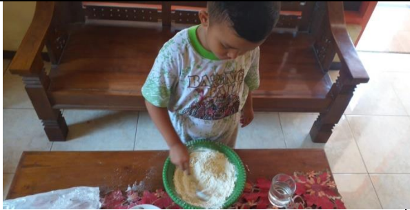
Anak membuat playdough