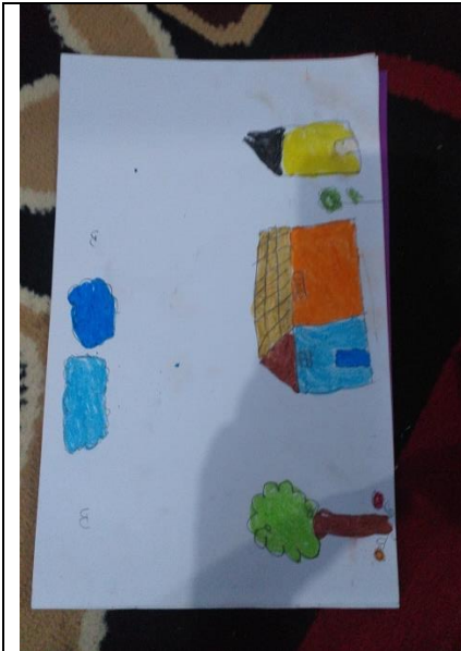
Hasil karya anak membuat lingkungan rumah