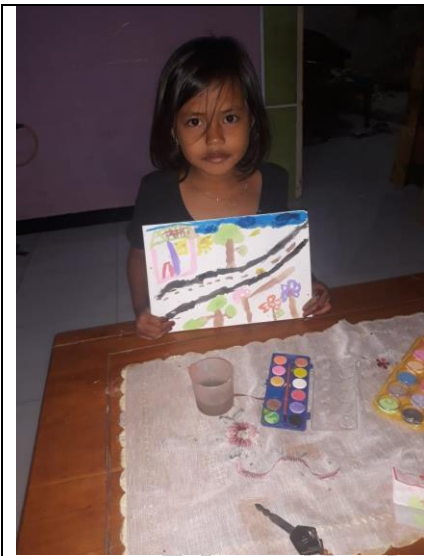
Hasil karya Anak Melukis