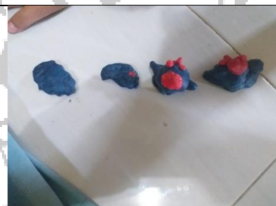
Karya anak membuat hewan dari playdough