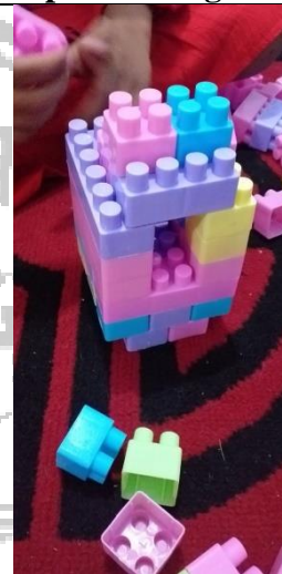
Karya anak membuat gazebo dari lego