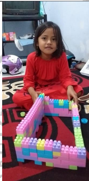
Anak mebuat gedung dari lego