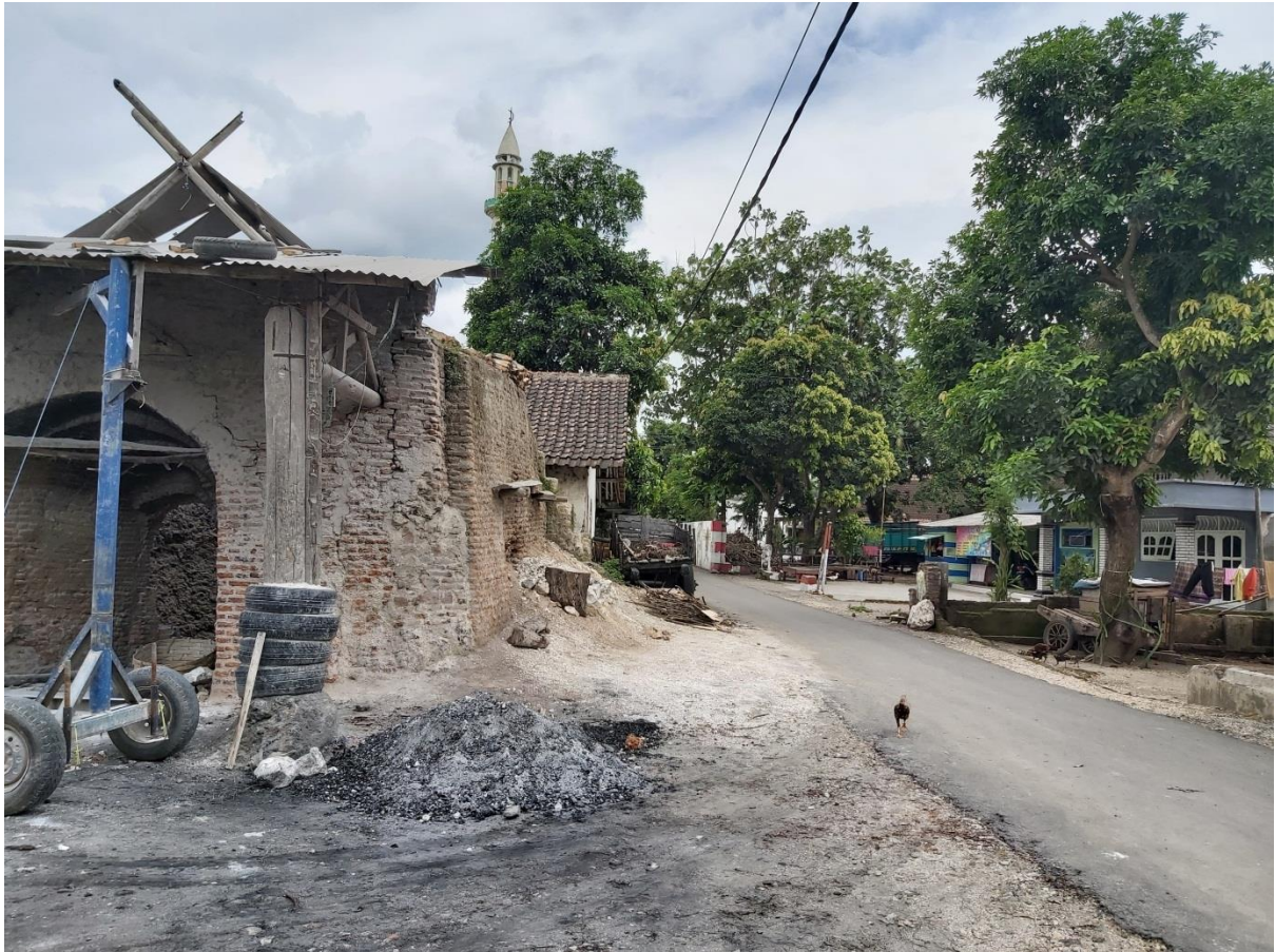
(Bentuk gambar pemukiman masyarakat yang tercemar)