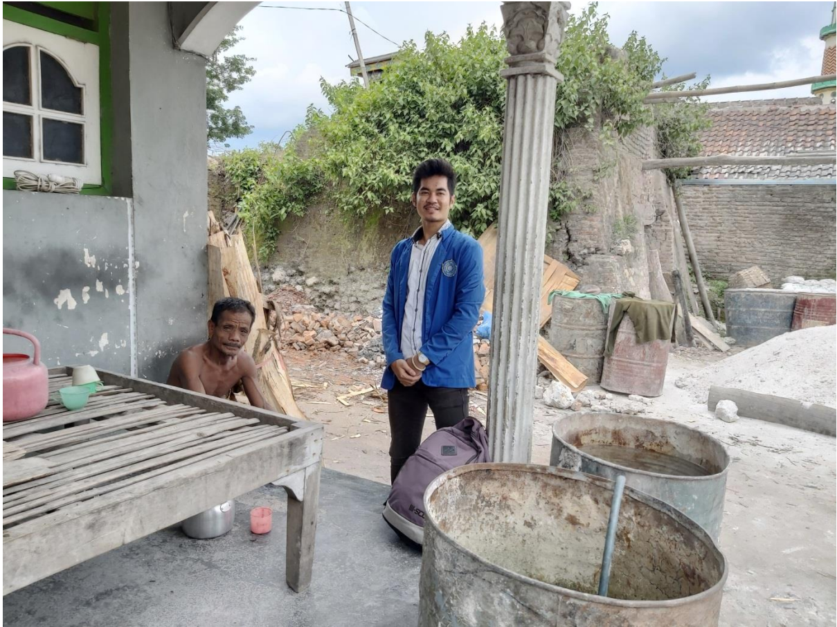
(Saat di lakukan wawancara dengan masyarakat sekitar tempat industri)