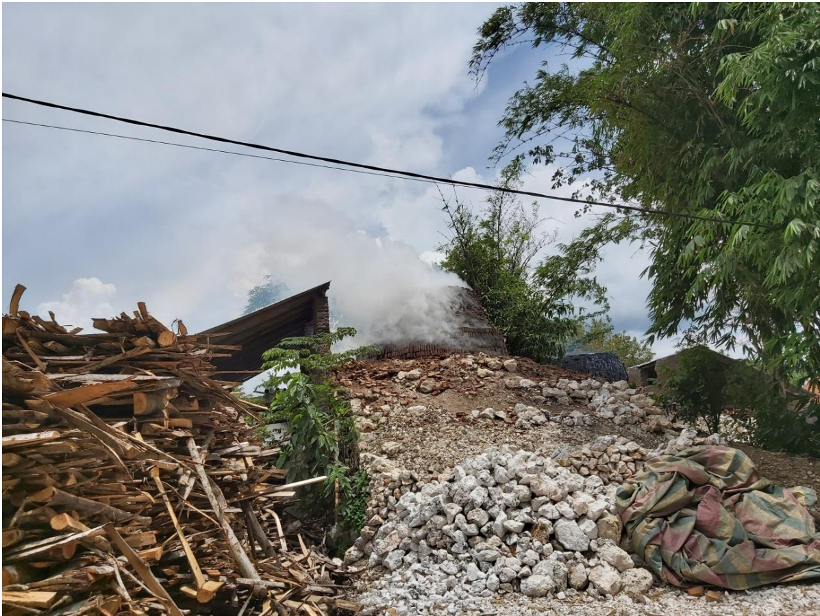
(Bentuk ganbar pembakaran batu gamping)