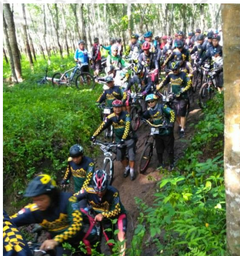
Acara Ngtrek Downhill berlatih bersama