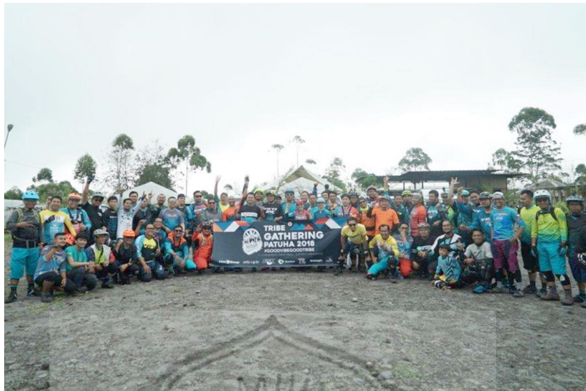
Acara Gathering Patuha Bike Park 2018