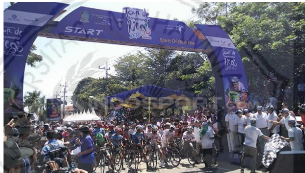
Acara Kegiatan Tour de Ijen