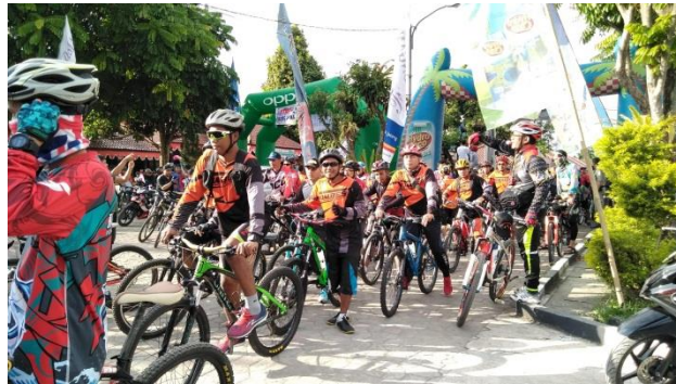
Acara Kegiatan Event Fun Bike