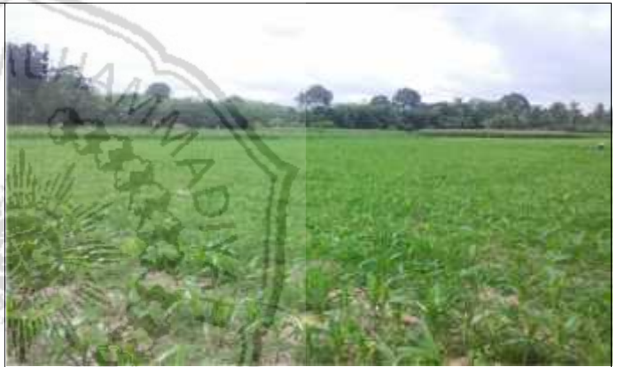
FOTO AKSES JALAN