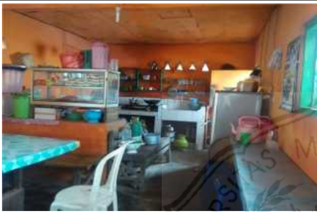
FOTO USAHA WARUNG