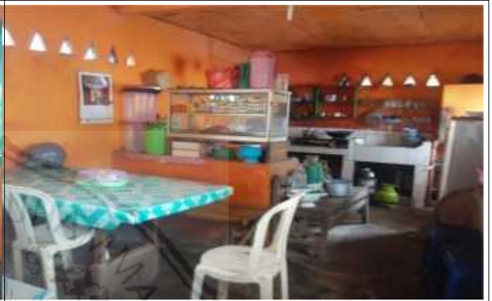
FOTO USAHA WARUNG