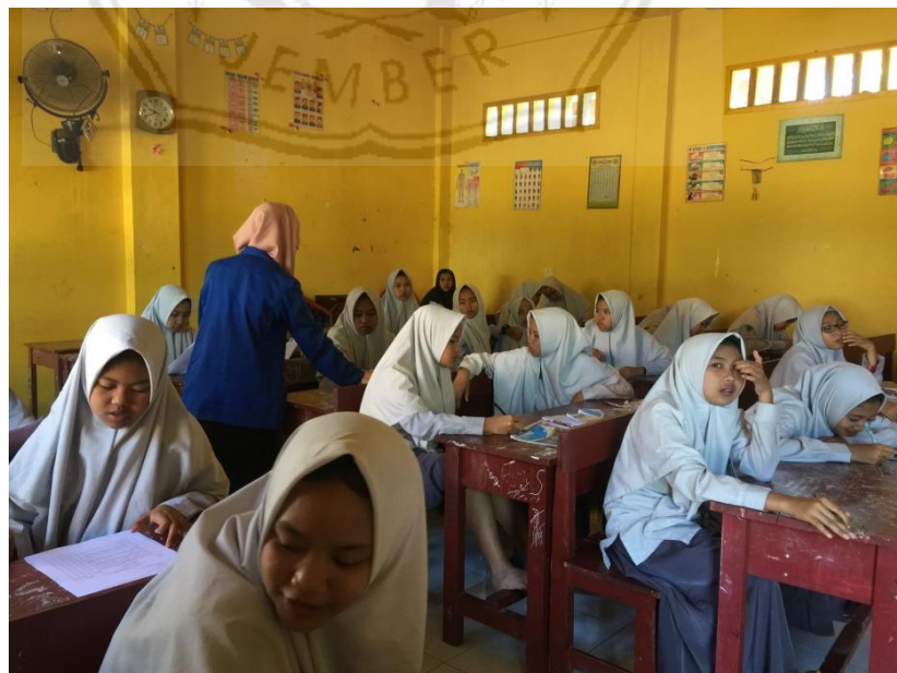
Siswa mengerjakan angket yang telah diberikan