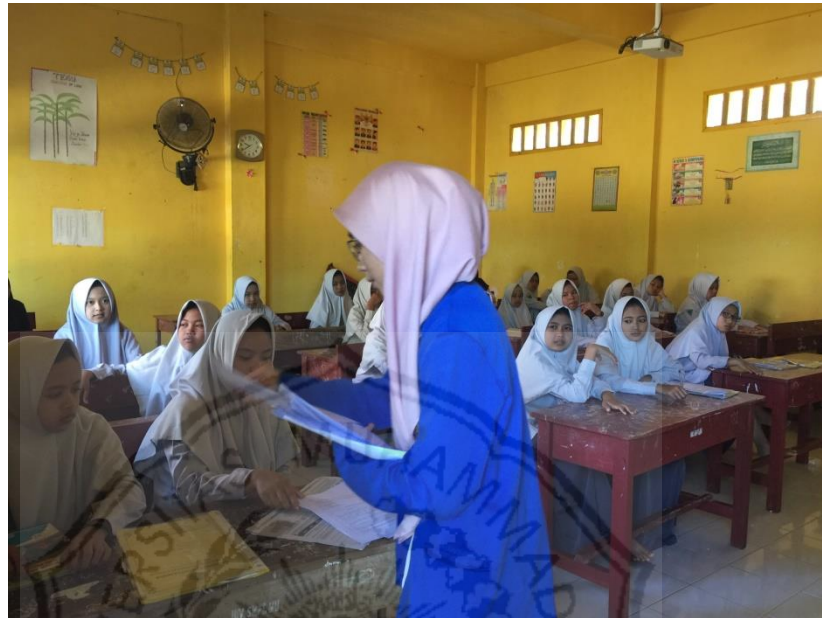
Peneliti membagikan lembar angket