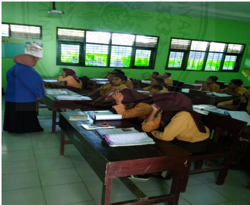
Gambar 2 Penyebaran dan Pengisian Instrumen Angket