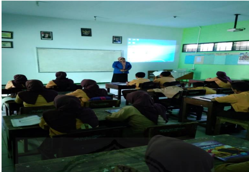
Gambar 1 Penyebaran Angket Penelitian