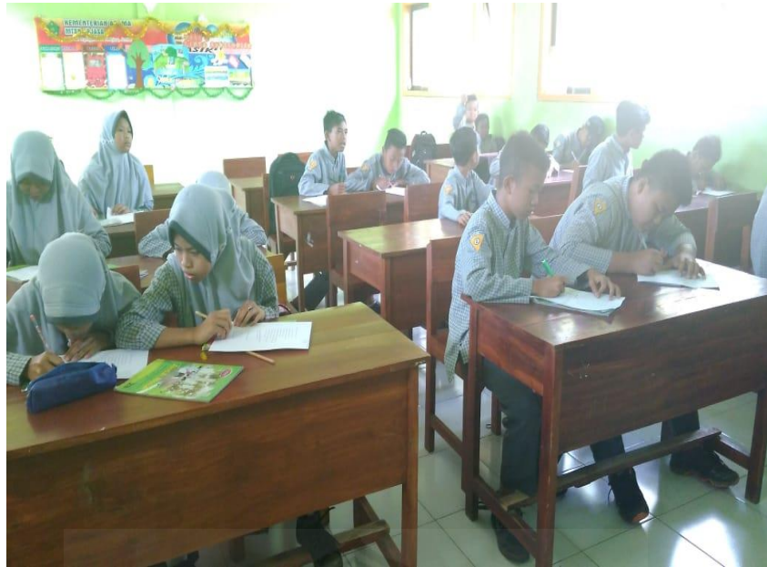
Gambar 3 Penyebaran dan pengisian Instrumen Angket