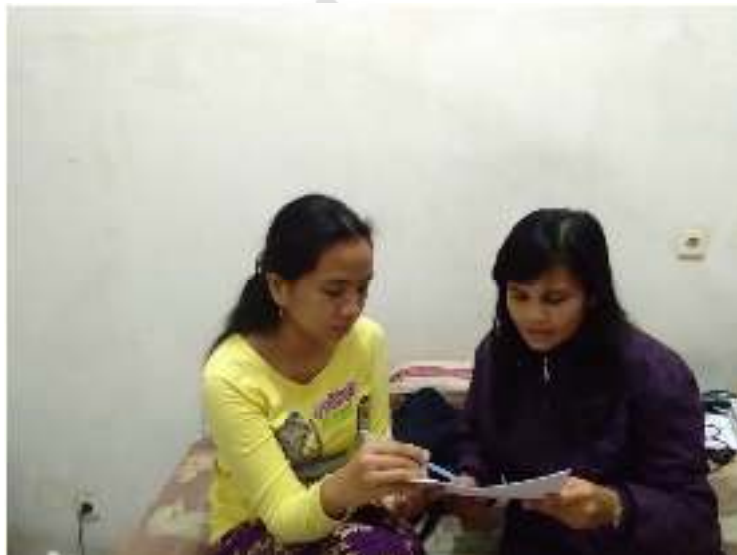
Gambar 4. Wawancara bersama Pekerja Pajak Pratama