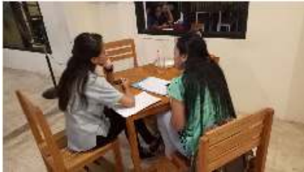
Gambar 3. Wawancara bersama Pekerja Warkop Brewok