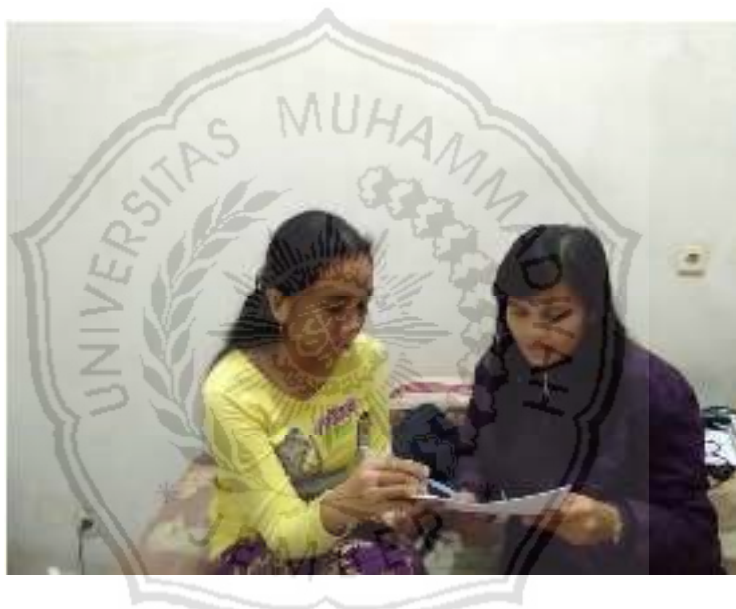
Gambar 4. Wawancara bersama Pekerja Pajak Pratama