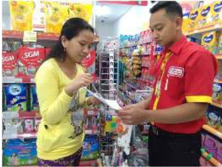
Gambar 5. Wawancara bersama Pegawai Alfamart.