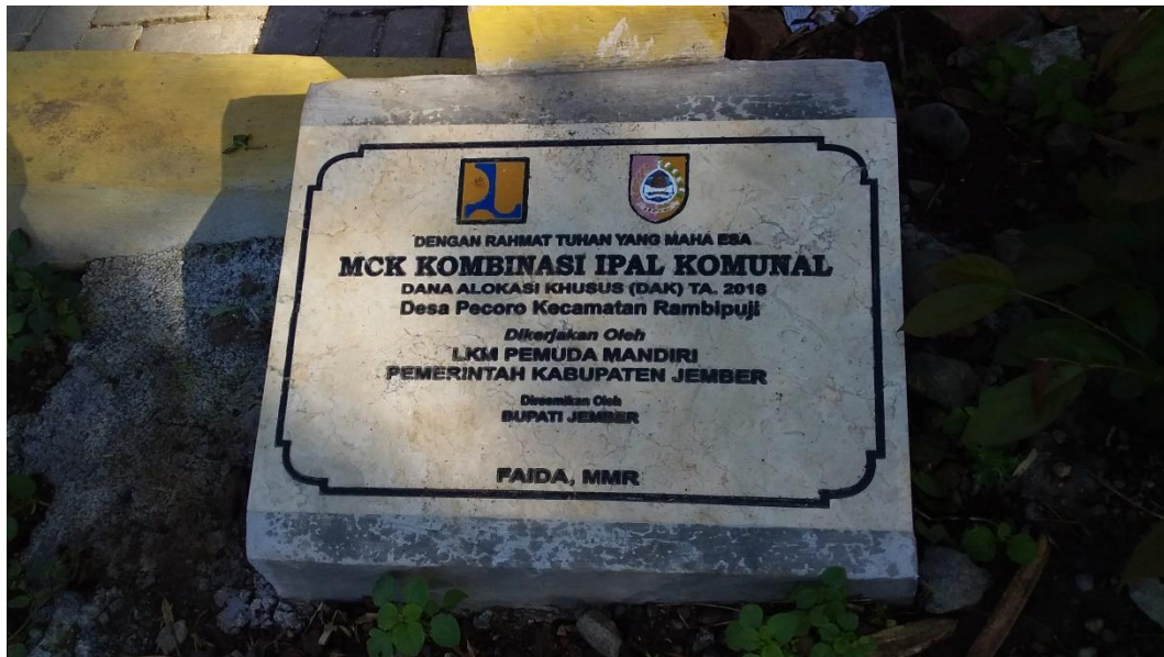
Gambar 5 : Batu pengesahan bangunan MCK dan IPAL