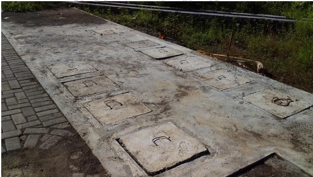
Gambar 4 : Banguna tangki septik/ IPAL