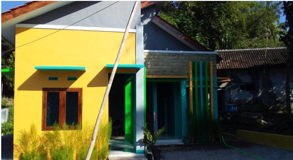
Gambar 3 : gedung/bangunan Mck lokasi Desa Pecoro Kecamatan Rambipuji Kab. Jember