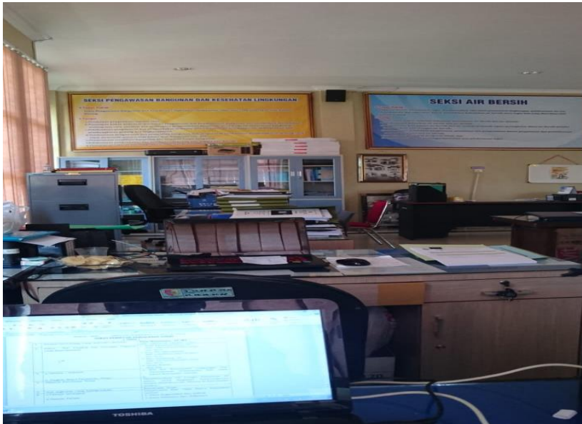
Gambar 1 : ruangan Dinas PUPR Dan Cipta Karya Kabupaten Jember