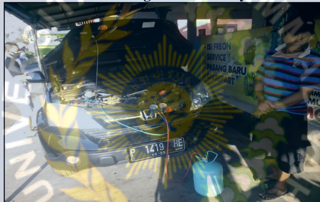
8. Proses Pengisian Freon