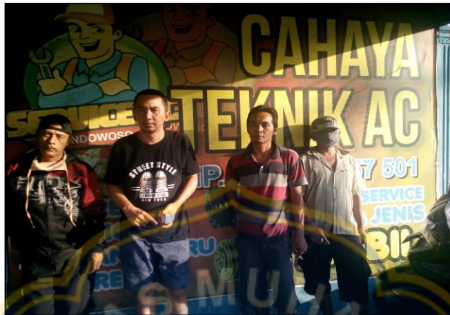
7. Pemilik dan Pegawai CV Cahaya Teknik