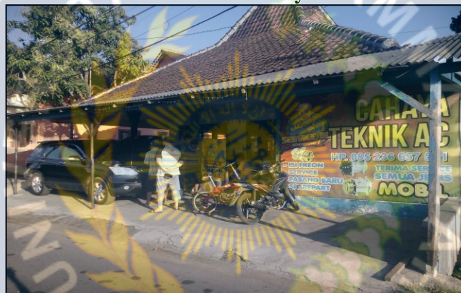
5. Bangunan CV Cahaya Teknik