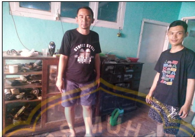
4. Peralatan CV Cahaya Teknik