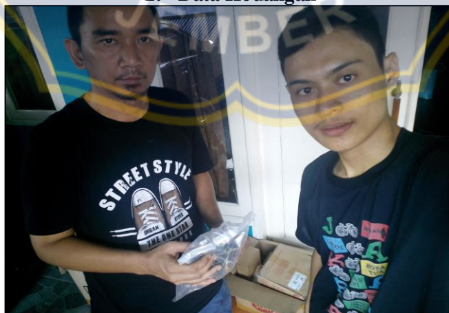
3. Perlengkapan / Sparepart