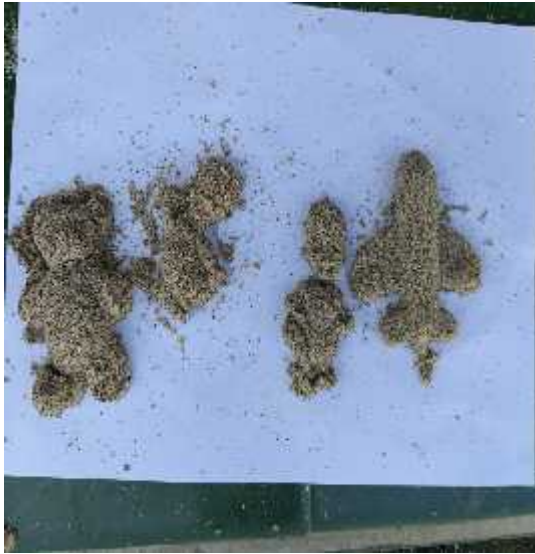
Mencetak 4 bentuk