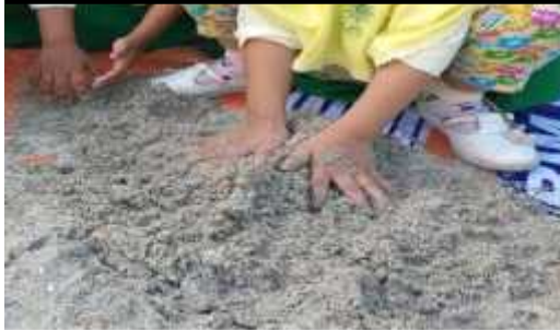
FOTO KEGIATAN BERMAIN PASIR

Kegiatan kedua anak bermain pasir membuat pola sesuai imajinasinya.