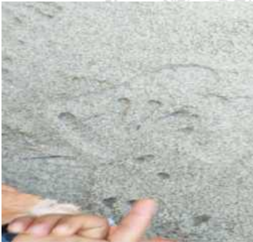
Mata kucing, ekor 5