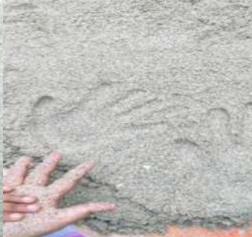
Sayap kupu kupu