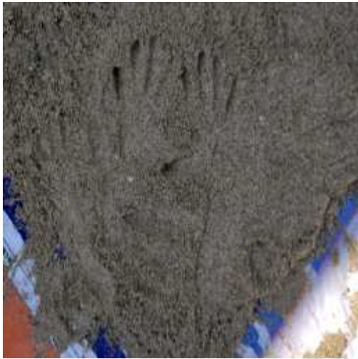
gambar bentuk kepala ayam, jejak kaki bebek, dan ekor bebek