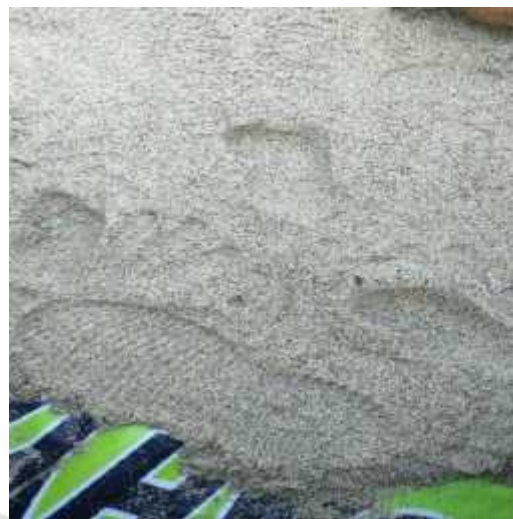
Ulat gemuk, ekor anjing, jejak kaki kuda