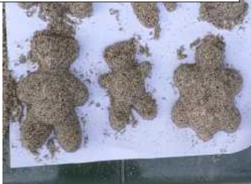
Mencetak 6 bentuk