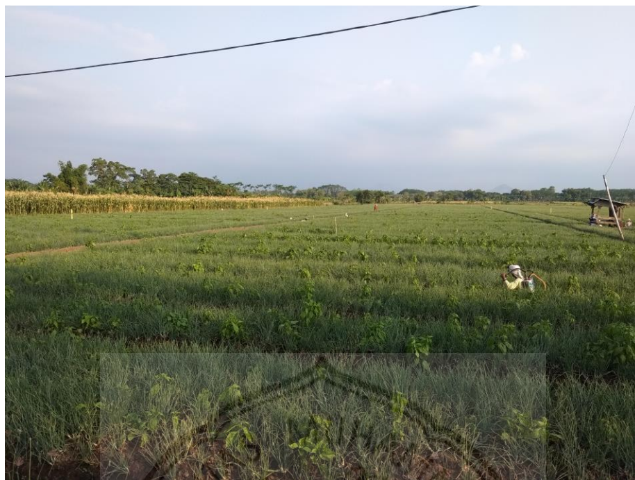
PENGENDALIAN HAMA PENYAKIT