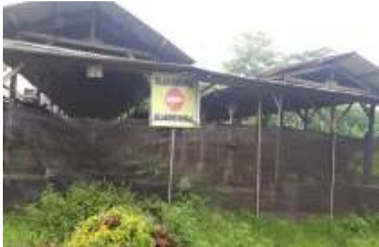
1. Kandang ayam ras retelur