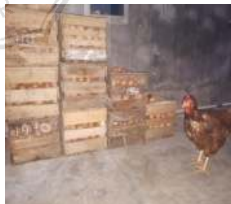
6. kotak telur