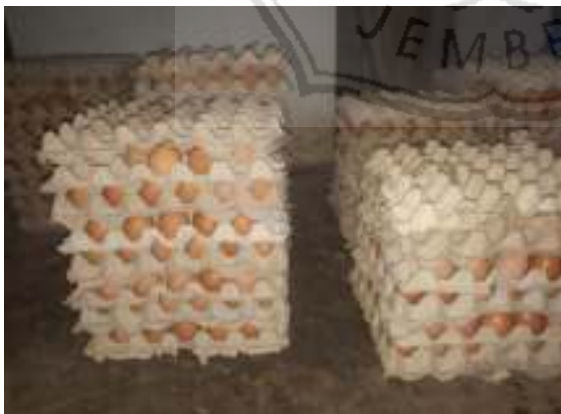
5. Egg tray