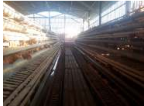
2. Kandang battery ayam ras petelur