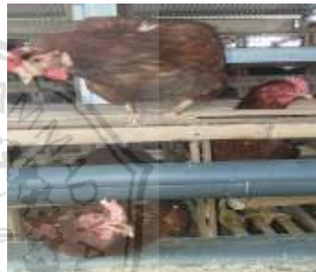
4. Ayam ras petelur