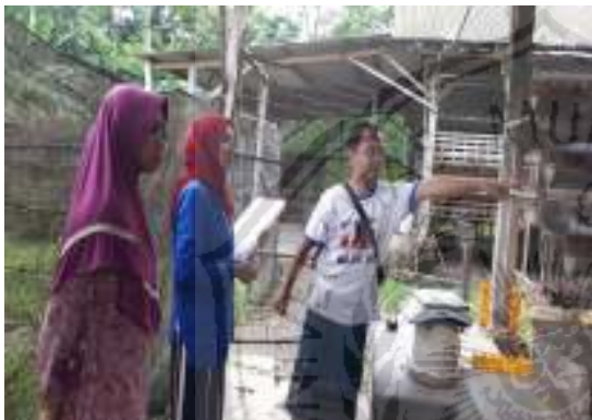
3. Wawancara dengan peternak ayam ras petelur