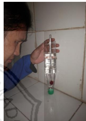
Gambar 4.24 Hasil Destilasi Ketiga

Gambar diatas menunjukkan Hasil pengujian destilasi tingkat kedua dengan hasil kadar etanol 49% dengan volume 650 ml dalam waktu 11 menit.