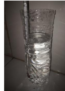
Gambar 4.23 Hasil Destilasi Kedua

Gambar diatas menunjukkan Hasil pengujian destilasi tingkat pertama dengan hasil kadar etanol 17% dengan volume 1100 ml dalam waktu 20 menit.