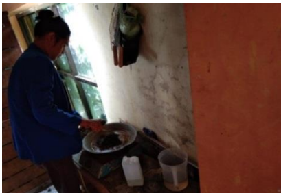
Gambar 4.18 Proses Hidrolisis

Masukkan 1500 ml aquades, biarkan sampai mendidih, lalu masukkan 1000 gram kulit kopi yang sudah dihaluskan, aduk sampai seperti bubuk (kental), lalu masukkan 500 ml asam klorida aduk rata kurang lebih 60 Menit dengan suhu didihnya 80-100°C. Lalu matikan kompor, dan angkat loyang supaya hasil hidrolisis kulit kopi, tidak terlalu panas.