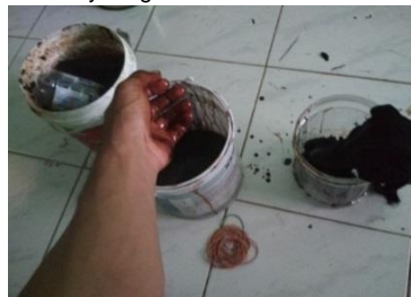
Gambar 4.20 Proses Penyaringan

Setelah difermentasi, saring menggunakan saringan halus.