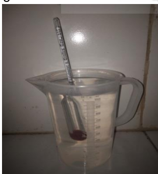
Gambar 4.22 Hasil Pengujian Destilasi Pertama

Sebelum menjadi etanol hasil fermentasi perlu adanya destilasi yang bertujuan untuk memisahkan air dengan etanol, destilasi dilakukan dalam 3 tahap dengan kadar, waktu dan volume yang berbeda, dalam destilasi menggunakan destilator mini kapasitas 5 liter. Pengujian kadar etanol menggunakan alcoholmeter dengan cara dicelupkan pada cairan hasil destilasi pertama kedua dan ketiga sampai menunjukkan persentase kadar (%) dari hasil pengukuran alcoholmeter.