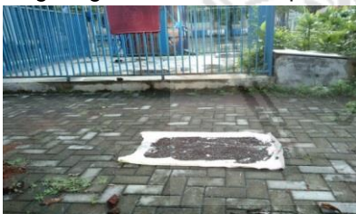
Gambar 4.17 Pengeringan Limbah Kulit Kopi

Proses pengeringan kulit kopi secara manual memerlukan waktu 2-3 hari untuk bisa kering total dengan menggunakan panas matahari (dijemur). Setelah kering total dihaluskan menggunakan blender rempah.