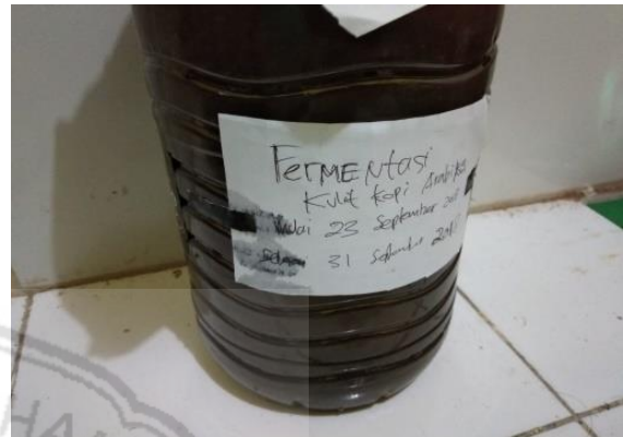
Gambar 4.19 Proses Fermentasi

Pada proses fermentasi dibutuhkan loyang atau wadah yang kedap udara. Masukkan terlebih dahulu 1000 ml tetes tebu pada wadah yang disediakan, lalu dilanjutkan dengan memasukkan hasil bahan yang sudah di hidrolisis pada wadah. Masukkan starter (meliputi Urea 150 gram dan NPK 150 gram, yang sudah dicairkan menggunakan 100 ml aquades). Lalu aduk rata hingga benar-benar rata dan tambahkan 150 gram ragi dan lanjutkan aduk. Kalau sudah diaduk rata semuanya tutuplah wadah tersebut dengan rapat-rapat. Proses fermentasi memerlukan waktu 7 hari. Agar prosesnya terjadi dengan sempurna untuk menghasilkan kadar etanol yang maksimal.