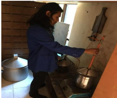
Gambar 4.21 Proses Destilasi

Masukkan hasil fermentasi pada destilator, lalu angkat destilator pada tunggu kompor, lalu hidupkan kompor, dengan suhu destilator 80 - 90°C untuk menghasilkan etanol kadar maksimal. Pastikan bahwa sirkulasi air berjalan dengan baik, sirkulasi air dimaksudkan agar dapat mengontrol kebutuhan panas pada menara pendingin dan pipa kondensor. Etanol akan keluar dari pipa kondensor, dan apabila etanol tidak menetes lagi itu menandakan kandungan etanol sudah habis.