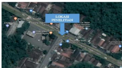
Gambar 3.1. Lokasi Penelitian

Lokasi Penelitian dilakukan pada simpang tiga tak bersinyal di Jalan Raya