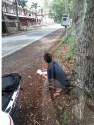
Survey LHR Ruas Jalan Kalibaru – Glenmore Kabupaten Banyuwangi