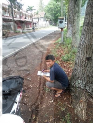
Survey LHR Ruas Jalan Kalibaru – Glenmore Kabupaten Banyuwangi