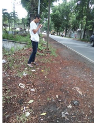
Survey LHR Ruas Jalan Kalibaru – Glenmore Kabupaten Banyuwangi