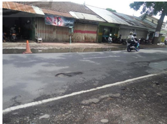
Kerusakan Jalan Pada Ruas Jalan Kalibaru – Glenmore Kabupaten Banyuwangi