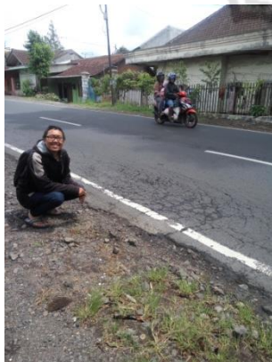
Kerusakan Jalan Pada Ruas Jalan Kalibaru – Glenmore Kabupaten Banyuwangi