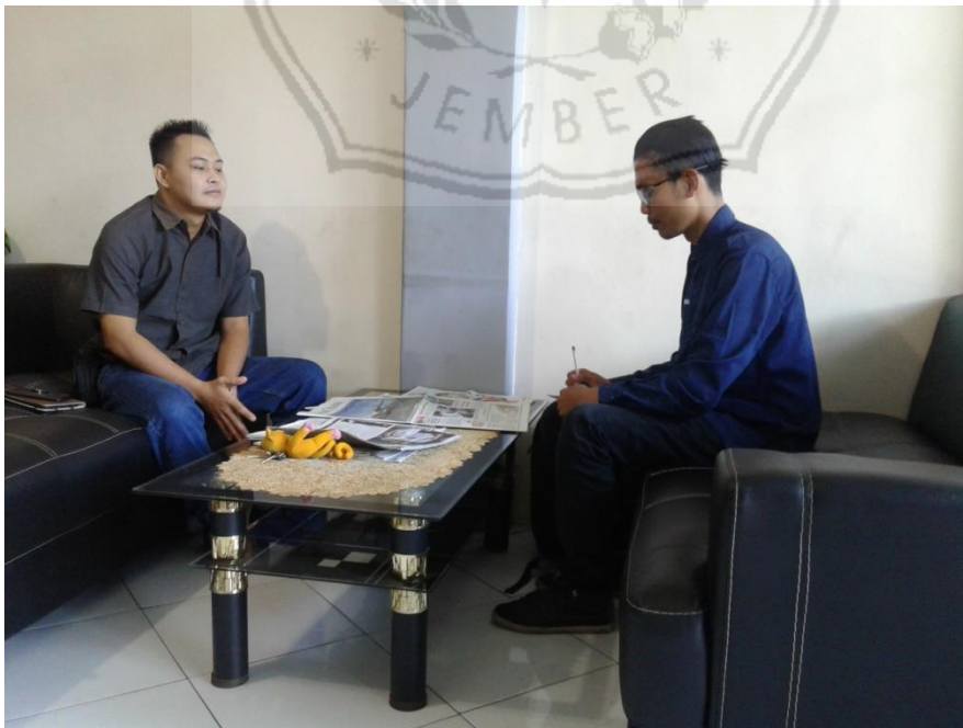
Gambar 6. Wawancara bersama Auskarni