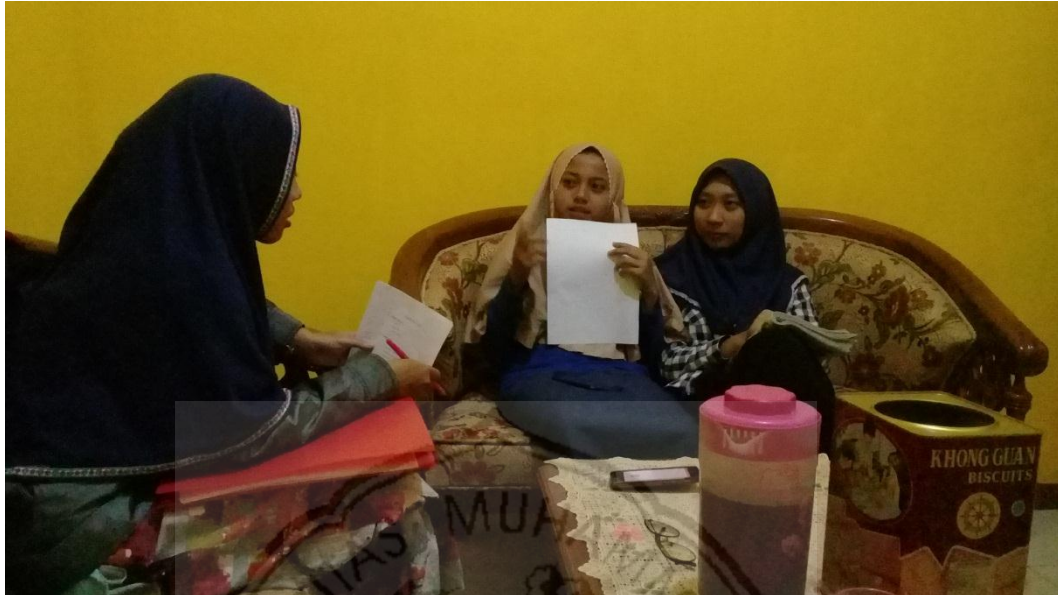
Gambar 1. Wawancara dengan Siswi Madrasah Aliyah