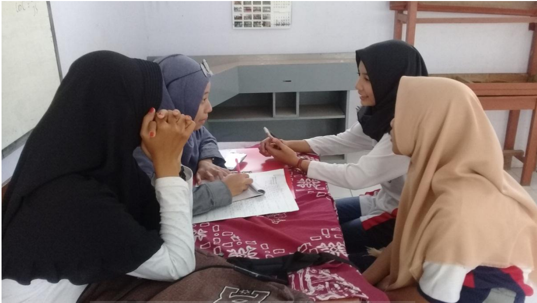
Gambar 3. Wawancara bersama Siswi SMK dan SMA