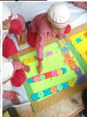
Kegiatan anak menghubungkan gambar dengan kata dengan pita dan perekat