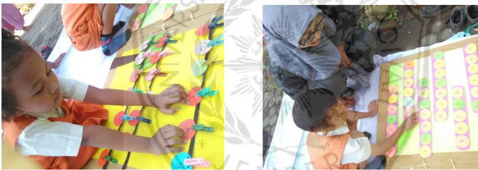
Kegiatan membaca huruf yang telah disusun anak