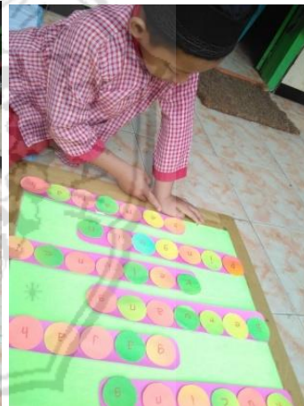
Kegiatan membaca huruf yang telah disusun anak