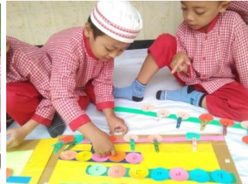
Kegiatan mencari kartu huruf dan menyusun huruf menjadi kata