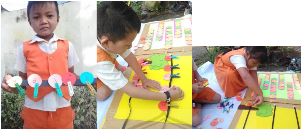
Kegiatan menjepit huruf dengan pita untuk menyusun huruf