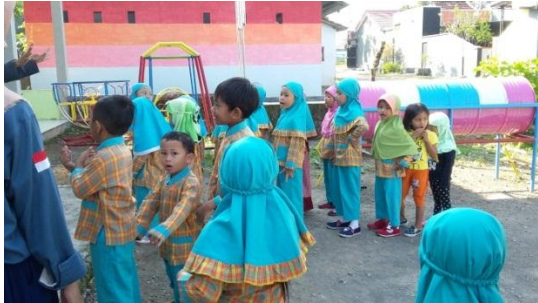
Anak berbaris Mendengarkan Penjelasan Guru