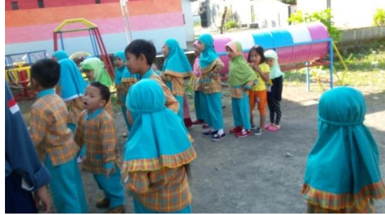
Anak mulai bermain Ular Naga