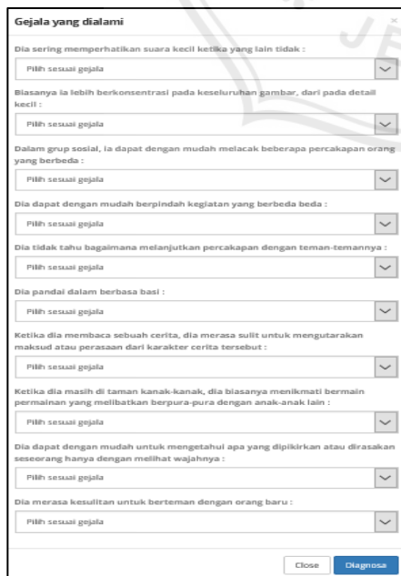
Gambar 3. 2 Tampilan halaman Deteksi Autis