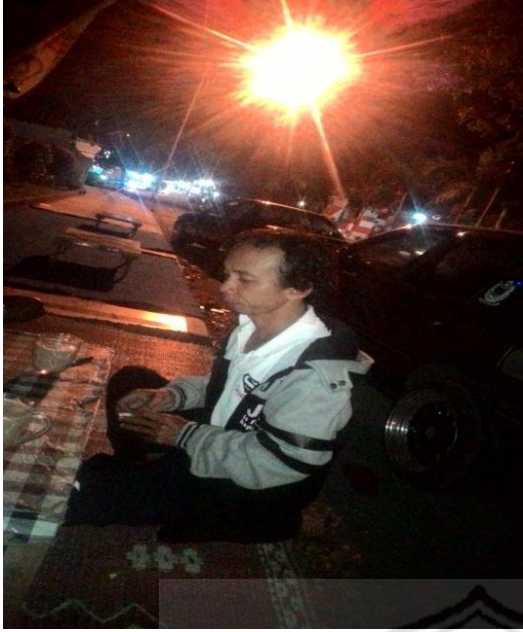
Nama: Kafir Member: Banyuwangi