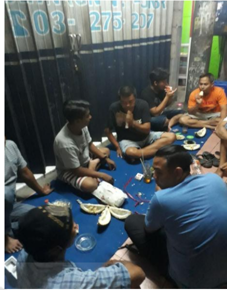
Nama suasana saat kopdar Tempat : Kopdar Jember