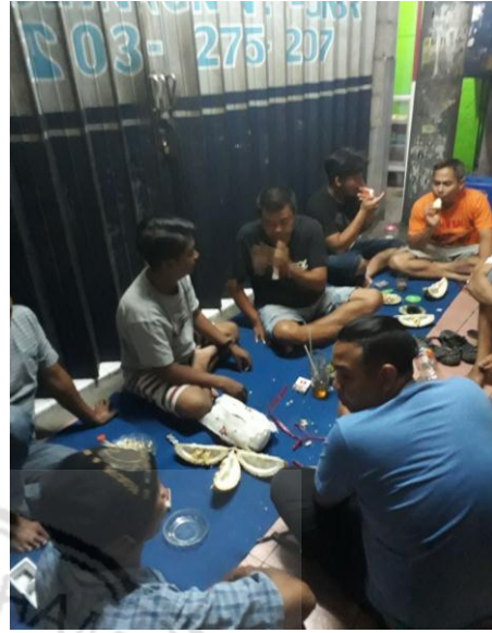
Nama suasana saat kopdar Tempat : Kopdar Jember