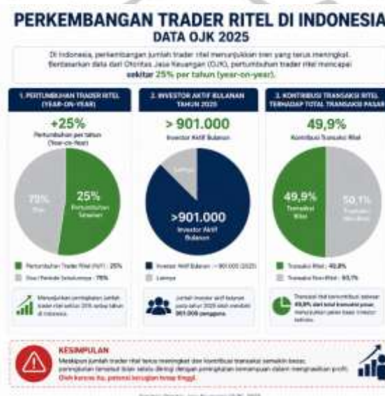
Gambar 1.2 Perkembangan Trader Ritel di Indonesia 2025

Di Indonesia, perkembangan ekosistem trading didukung oleh kemajuan teknologi informasi, meningkatnya penetrasi internet, serta kemudahan akses terhadap platform perdagangan daring. Data OJK menunjukkan bahwa jumlah investor ritel aktif pada tahun 2025 telah melampaui 901.000 pengguna dan mengalami pertumbuhan rata-rata sekitar 25% per tahun (OJK, 2025). Peningkatan ini menunjukkan semakin besarnya minat masyarakat terhadap instrumen investasi dan perdagangan berbasis pasar keuangan, termasuk forex, emas, saham, dan aset derivatif lainnya.