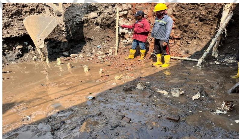
Gambar 1. 2 Pemasangan cerucuk kayu galam

Di lapangan, metode perbaikan tanah yang digunakan dengan memasang cerucuk kayu galam untuk meningkatkan daya dukung tanah. Tiang kayu jenis kayu galam memiliki sifat tidak mudah busuk dalam keadaan terendam dibawah air, sehingga kayu ini sangat cocok untuk daerah dengan kondisi tanah lunak. Meskipun metode ini cukup efektif, namun terdapat keterbatasan dari segi kapasitas dukung tiang dan pengendalian penurunan, terutama untuk jangka panjang. Penggunaan cerucuk kayu galam membutuhkan banyak tiang kayu karena memiliki panjang yang terbatas dan kapasitas dukung yang juga terbatas (Ridwansyah, 2022).